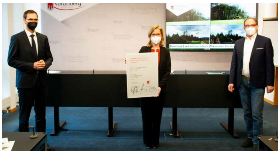
Изображение 2: Министр по охране климата Леоноре Гевесслер, губернатор Маркус Вальнер и советник провинции Йоханнес Раух из федеральной земли Форарльберг подписывают соглашение о партнёрстве между федеральным правительством и землёй по программе klimaaktiv mobil для расширения велосипедной инфраструктуры в Форарльберге.

В рамках инициатив по преодолению кризиса Covid-19 районы и города смогли получить дополнительную 50% -ную федеральную субсидию на расширение велосипедного и пешеходного движения через Закон о муниципальных инвестициях 2020-го года и совместить это с субсидированием klimaaktiv mobil .