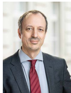
Магистр доктор Юрген Шнайдер

Защита климата - главный приоритет австрийского федерального правительства. Используя klimaaktiv mobil, мы предлагаем широкий спектр финансовых мер для поддержки перехода к устойчивой и экологически безопасной мобильности. Таким образом, мы вносим важный вклад в защиту климата и в выполнение Национального плана в области энергетики и климата и тем самым в наше продвижение по пути к климатической нейтральности в 2040-м году. — Магистр доктор Юрген Шнайдер, руководитель секции климата и энергетики ВМК (временно исполняет обязанности руководства)