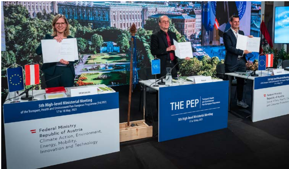
Изображение 13: Веха на пути к климатически безопасной, здоровой мобильности в Европе: федеральный министр Леоноре Гевесслер и федеральный министр Вольфганг Мюкштайн вместе с австрийским председателем THE PEP Робертом Талером представляют Венскую министерскую декларацию «Строить будущее лучше путем перехода к новой, чистой, безопасной, здоровой и инклюзивной мобильности и транспорту», принятую на 5-й Общевропейской министерской конференции по транспорту, здоровью и окружающей среде.

Наивысшим конкретным результатом министерской конференции стало принятие первого в истории общевропейского генерального плана по развитию велосипедного движения. Этот общевропейский генеральный план был разработан под руководством Австрии и Франции при участии 28 стран, ЕЭК ООН, ВОЗ, ЕКФ и велоиндустрии. Генеральный план содержит конкретные цели и рекомендуемые меры по развитию велосипедного движения во всей Европе. Цель: удвоить количество велосипедов в общевропейском регионе к 2030-му году. Кроме того в каждой стране должны быть разработаны национальные стратегии развития велосипедного движения, расширена инфраструктура активной мобильности, а велосипедное движение должно быть более прочно закреплено в других областях, таких как политика здравоохранения и городское и территориальное планирование.