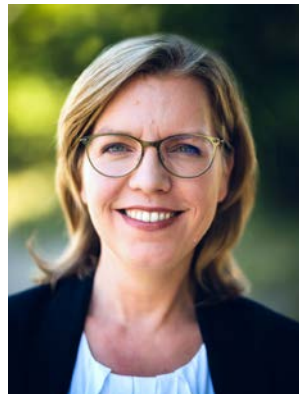
Министр по защите климата Леоноре Гевесслер

С помощью новых активных дотационных кампаний программы klimaaktiv mobil мы можем поддержать австрийские предприятия, города и муниципалитеты, туристические и образовательные учреждения в преодолении экономических последствий кризиса Covid -19 и на пути к экологически безопасной мобильности. Таким образом мы обеспечиваем защиту климата и стимулируем рост привлекательности регионов.