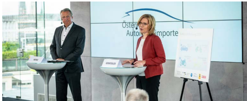
Изображение 5: Министр защиты климата Леоноре Гевесслер и Гюнтер Керле, председатель рабочей группы импортёров автомобилей в Федерации промышленности, представляют новые субсидии на электромобильность на 2020-й год.

Для проведения кампаний по финансированию будут использоваться проверенные инструменты финансирования ВМК - Климатический и энергетический фонды, программа klimaaktiv mobil и национальное экологическое финансирование. Чтобы максимально упростить подачу заявок на субсидии, дотационные схемы обрабатываются компанией Kommunalkredit Public Consulting GmbH (KPC) как One-Stop-Shops (единое окно, весь комплекс процессов вместе) (umweltfoerderung.at).