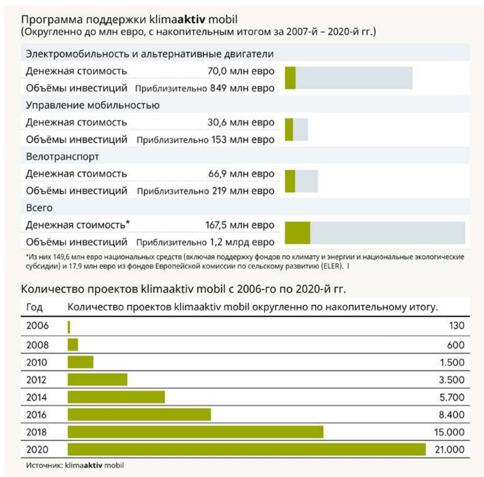
Изображение 9: Программа поддержки klimaaktiv mobil и число проектов klimaaktiv mobil