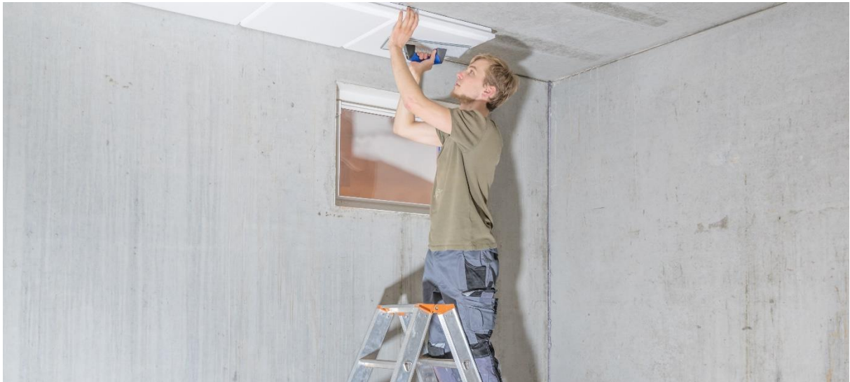
Kellerdämmung anbringen

Die nachträgliche Dämmung der Kellerdecke zahlt sich aus: Bis zu 10 Prozent der Heizenergie geht über eine ungedämmte Kellerdecke verloren. Das Dämmmaterial kann meist relativ einfach selbst angebracht werden. Den Effekt der Maßnahme spürt man direkt an den Fußsohlen: durch die Kellerdeckendämmung wird der Fußboden angenehm warm.