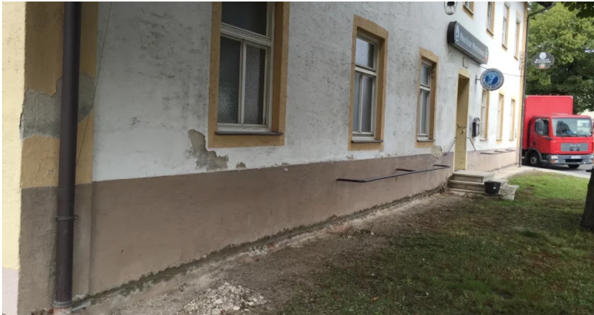
Abbildung 2: Feuchtigkeitsschäden an der Gebäudefassade (Haböck&Weinzierl GmbH, Mauertrockenlegung, 3130 Herzogenburg)

Achtung: Bei allen anderen Ursachen sind diese kostspieligen Methoden von vornherein zum Scheitern verurteilt und es gilt die richtige Abhilfe für das jeweilige Problem zu finden. Dies kann das Anbringen einer Außenwanddämmung bei Kondensationsfeuchtigkeit an der Mauerinnenoberfläche oder die Instandsetzung defekter Rohre oder Bauteile wie zum Beispiel des Daches sein.