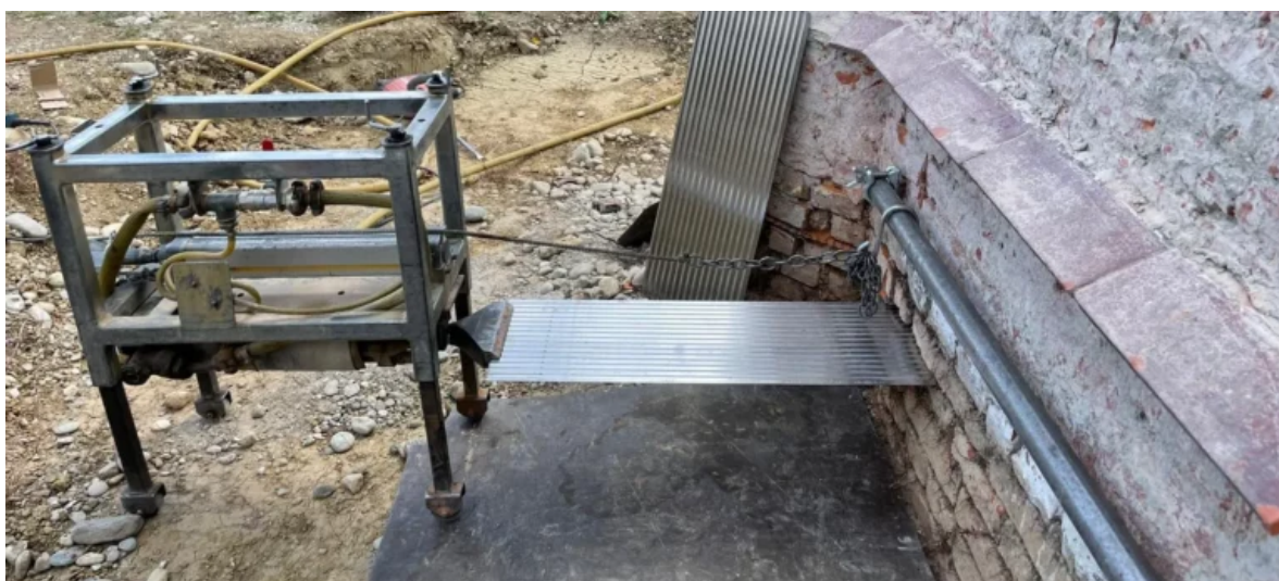
Abbildung 3: Anwendung Chromstahlblechverfahren (Haböck&Weinzierl GmbH, Mauertrockenlegung, 3130 Herzogenburg)

Das Verfahren ist grundsätzlich für jede Mauerstärke anwendbar. Ab einer Stärke von mehr als 1 Meter werden die Platten beidseitig eingeschlagen. In Abhängigkeit der im Vorfeld erforderlichen Untersuchung des Mauerwerks in Hinblick auf Belastungen (zum Beispiel gelöste Salze) muss das passende hochwertige und korrosionsbeständige Material gewählt werden. Nur so kann sichergestellt werden, dass die Maßnahme dauerhaft erfolgreich ist. Zu guter Letzt muss der zur Verfügung stehende Arbeitsraum mindestens einen Meter breit sein.