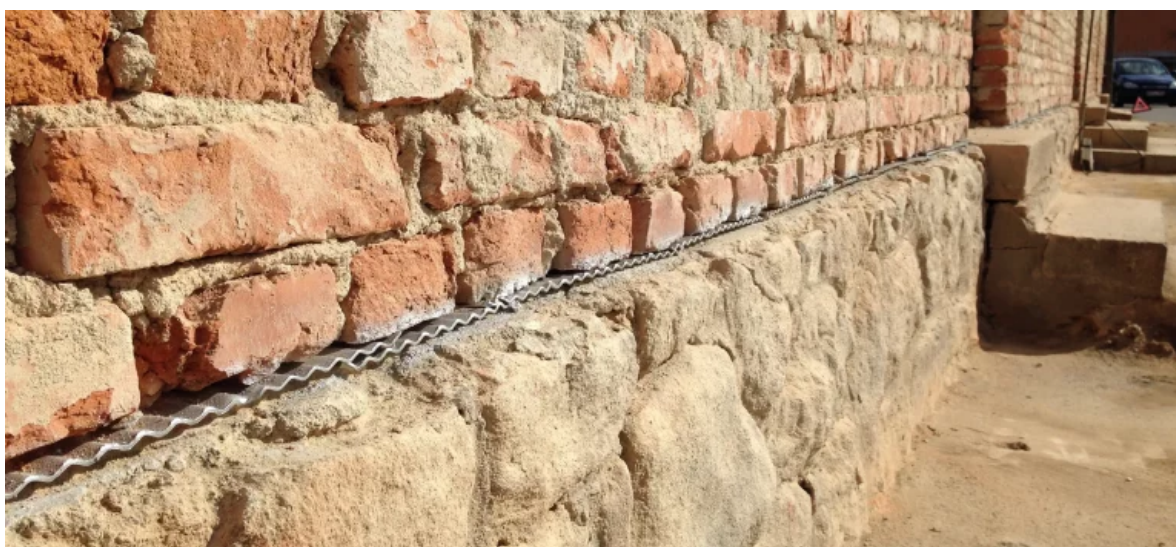
Abbildung 4: Anwendung Horizontalsperre (Haböck&Weinzierl GmbH, Mauertrockenlegung, 3130 Herzogenburg)

Häufig ist Wasser, das von außen durch die Wand drückt, für Feuchtigkeit im Keller verantwortlich. Daher wird das betroffene Mauerwerk beim Mauersägeverfahren mit einem horizontalen Schnitt geteilt. In diesen Spalt führen die Handwerker ein rostfreies Blech oder eine Kunststoff-Folie ein. Diese Horizontalsperre sorgt dafür, dass aufsteigender Feuchtigkeit der Weg in den Keller versperrt wird.